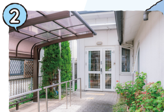
グループホーム敬愛 → P11