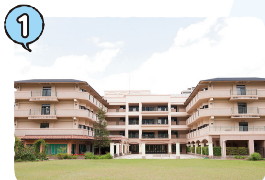
社会福祉法人聖徳園 ひらかた聖徳園 特別養護老人ホームひらかた聖徳園 → P12 ひらかた聖徳園ショートステイ → P12 ひらかた聖徳園デイケアセンター → P09