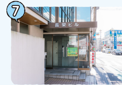
ひらかた聖徳園訪問看護ステーション サテライト長尾駅前 → P08