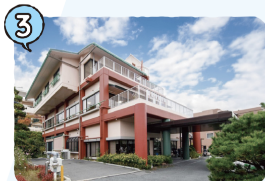
ひらかた聖徳園ホームケアセンター 聖徳園介護支援センター → P05 ひらかた聖徳園ホームヘルパーステーション → P07 ひらかた聖徳園訪問看護ステーション → P08 拠所 ふらっと香里の丘 → P13