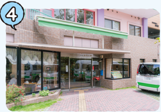
香里丘デイサービスセンター → P10