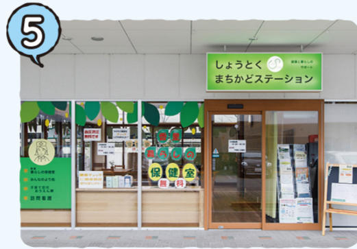
しょうとく*まちかどステーション → P13