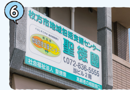
枚方市地域包括支援センター聖徳園 社会福祉法人 聖徳園 072-836-5555 当ビル2階 高齢者の相談窓口 → P06