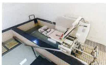
車椅子の方、歩行が困難な方も入浴できる特殊 浴槽です。