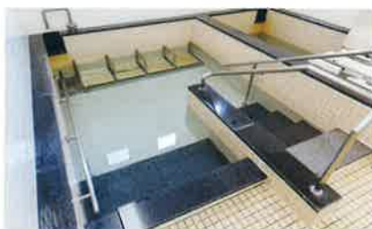
手足を伸ばしてゆっくりできる広い浴槽です。