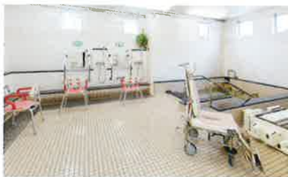
清潔感のある、広々とした浴室です。