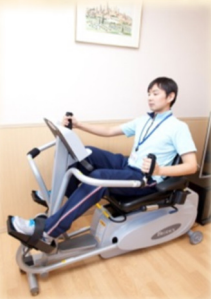
バイオステップ (有酸素運動)

体力・筋力・体重をもとに、適切な負荷の設定で4種類のマシンに取り組んでいただきます。運動指導員が、正しいフォームで行えるようにサポートいたします。