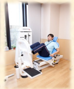
レッグプレス (下半身の運動)