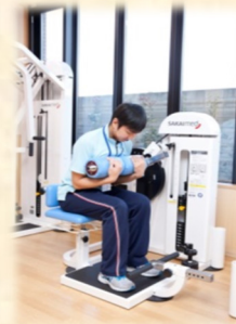
トーンフレクション (腹筋運動)