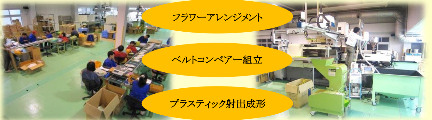
プラスチック射出成形