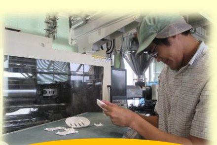
プラスチック射出成形