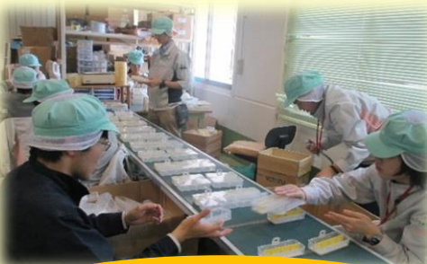
ベルトコンベアー組立