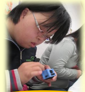
生活介護 創作活動