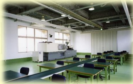
成形部・組立部作業室